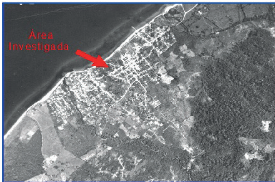
Imagen 4. Vista aérea de la ciudad de Trujillo, década de los 70.

ta la estructura de la Fortaleza. La inspección fue llevada a cabo y se constató que la alcaldía había invadido y dañando la loma sobre la que se levanta la fortaleza. Asimismo, se recolectó material arqueológico, cerámico, y se llevó a cabo la interrupción de los trabajos de construcción. Posteriormente se hace la propuesta para realizar un rescate arqueológico en esta área, para definir mejor parte de la historia de la ciudad, así como la historia hondureña.