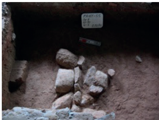
Imagen 5. Hallazgos de muros y pisos.