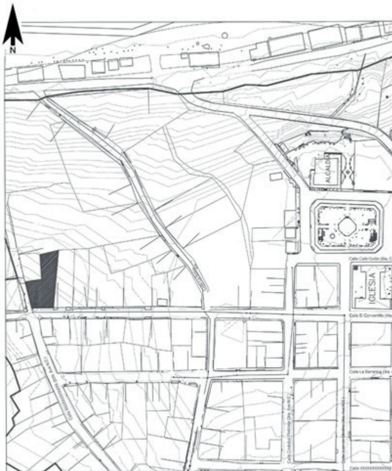
Imagen 1. Centro Histórico de Trujillo, mostrando ubicación del predio.