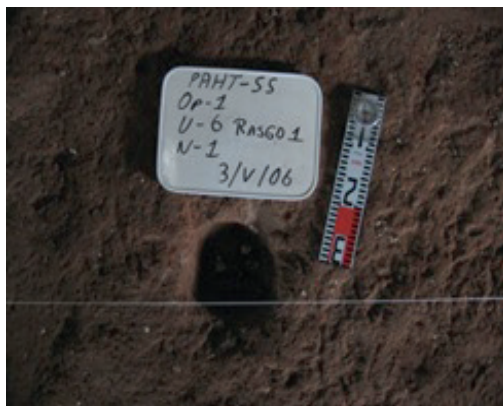
Imagen 6. Huellas de poste.

dos en el interior son todos similares, lo que resulta, que se interpretó como una sola etapa constructiva, de inicio a fin.