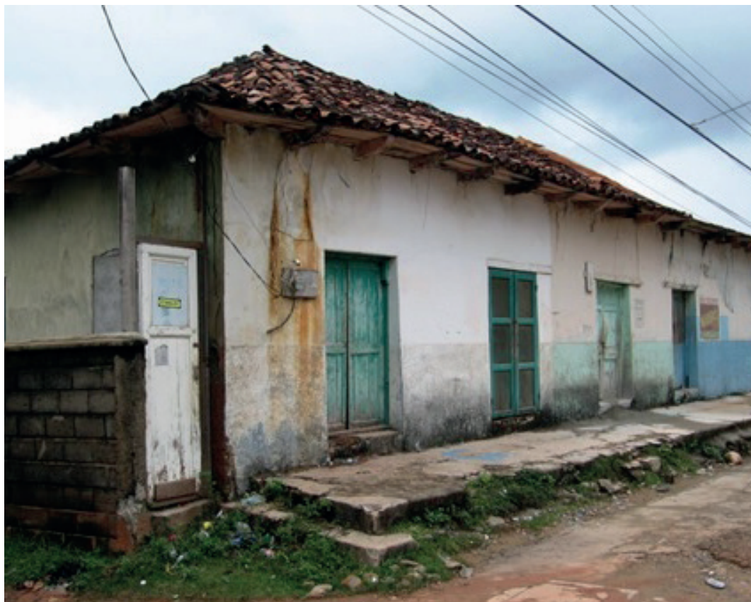
Imagen 2. Fachada de la casa antes de la investigación.