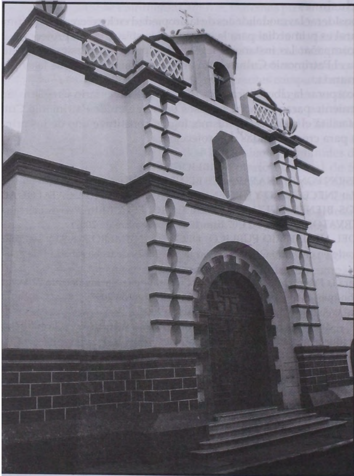
Iglesia Inmaculada Concepción de Comayagua.