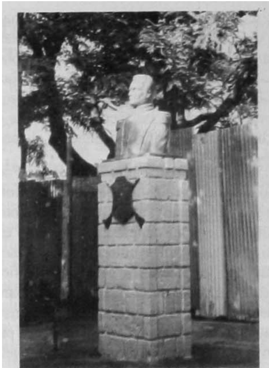
Figura 3. Busto de Francisco Morazán .