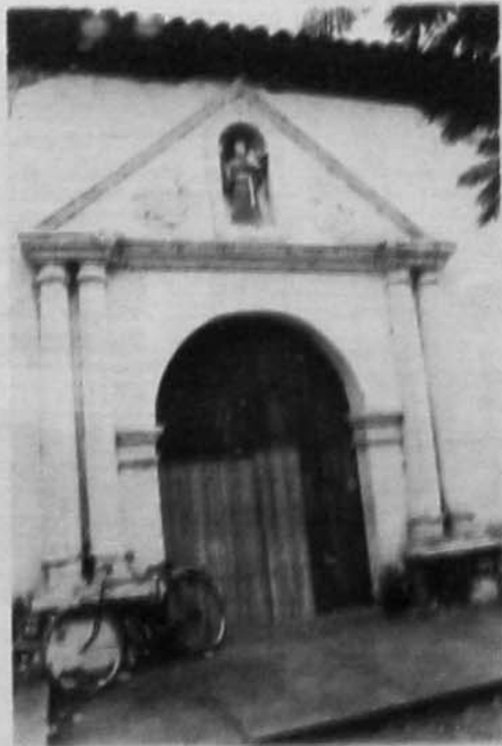
Figura 4. Puerta lateral de la Iglesia ubicada en el centro del Parque "San Francisco".

La sección al sur de la Iglesia de "San Francisco", donde se ubicaban tanto la cruz atrial como el cementerio, era una terracería con una pequeña banqueta de piedra que se dirigía a la puerta lateral de la Iglesia, en la llamada Puerta de "San Antonio"