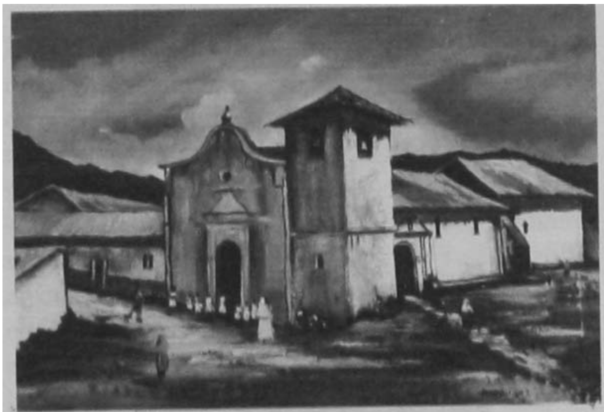
Figura 2. Imagen de la Iglesia de "San Francisco" (sin fecha). Probablemente sea copia de una fotografía de principios del siglo XX. Pintura en el Instituto "Inmaculada Concepción" de Comayagua.

En 1958 se levantó el Parque, donde las Fuerzas Armadas colocaron un busto de Francisco Morazán en el centro del mismo (Figura 3). Para este momento el edificio que antes ocupaba el Convento estaba siendo reutilizado para la ubicación de una escuela, modificando los interiores pero sin modificar la fachada exterior. Toda la manzana que abarca el Parque, la Iglesia y lo que actualmente es el Instituto "Inmaculada Concepción" se dividía en dos partes, siendo la mayor la de los terrenos de la escuela, ya que se habían extendido hacia el oeste para ocupar el terreno hasta la calle.