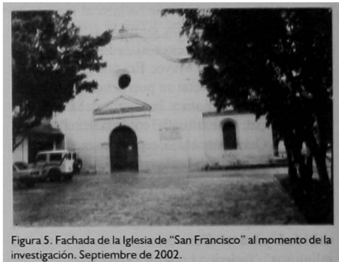
Figura 5. Fachada de la Iglesia de "San Francisco" al momento de la investigación. Septiembre de 2002.

(Figura 4). Sin embargo, pocos años después, al unirse algunos propietarios de negocios alrededor del Parque, se comenzó la construcción de una cancha de basketball, con el tendido de una plancha de cemento que cubrió completamente la sección este del Parque, a partir de la esquina sureste hasta casi la sección central. Al mismo tiempo, se colocan en la sección oeste algunos juegos infantiles (columpios, toboganes), los cuales tuvieron una relativa corta existencia ya que fueron finalmente removidos en 1995, cuando se empedró el acceso a la Puerta Mayor de la Iglesia de "San Francisco". De esta manera, el Parque "San Francisco" obtiene su aspecto actual (Figura 5).