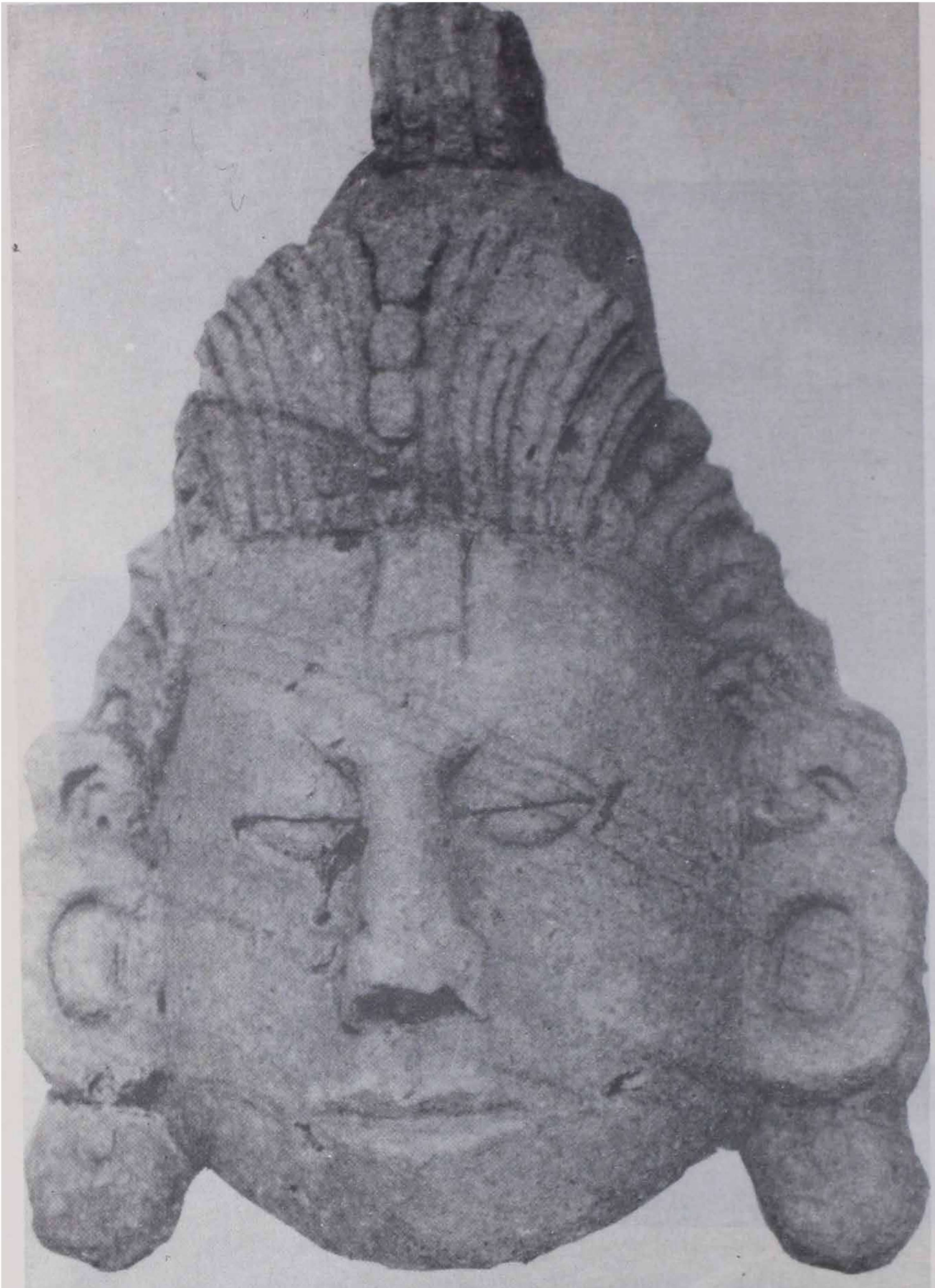
4. Cabeza humana asociada con la Estructura 195 del Complejo CV-26.