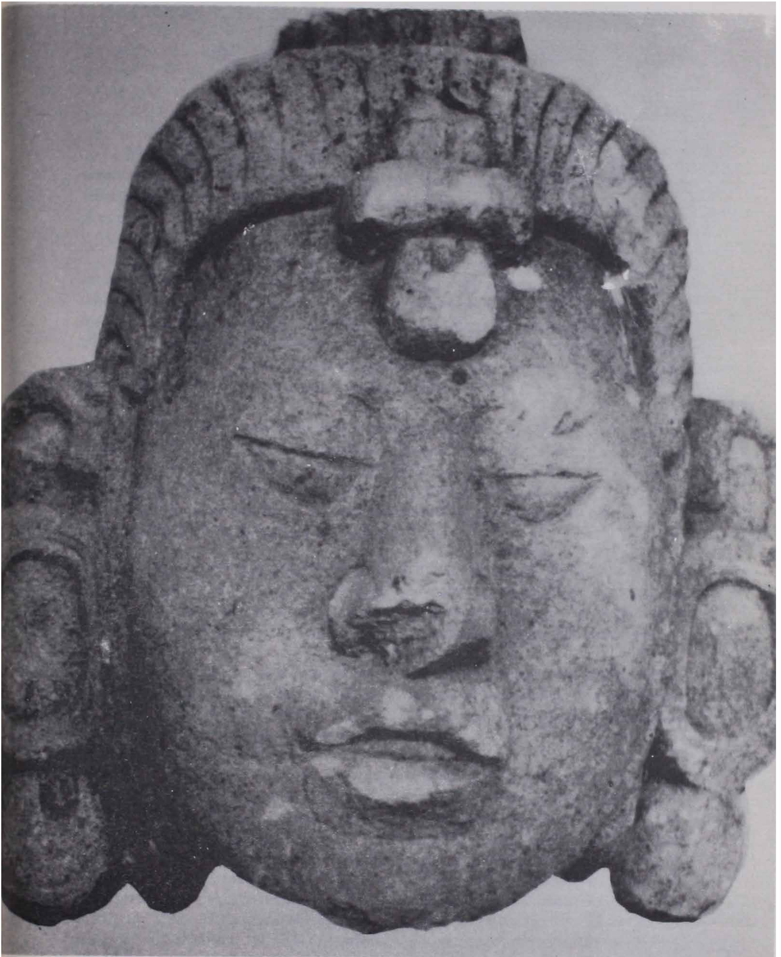
5. Cabeza humana asociada con la Estructura 189 del Complejo CV-30.