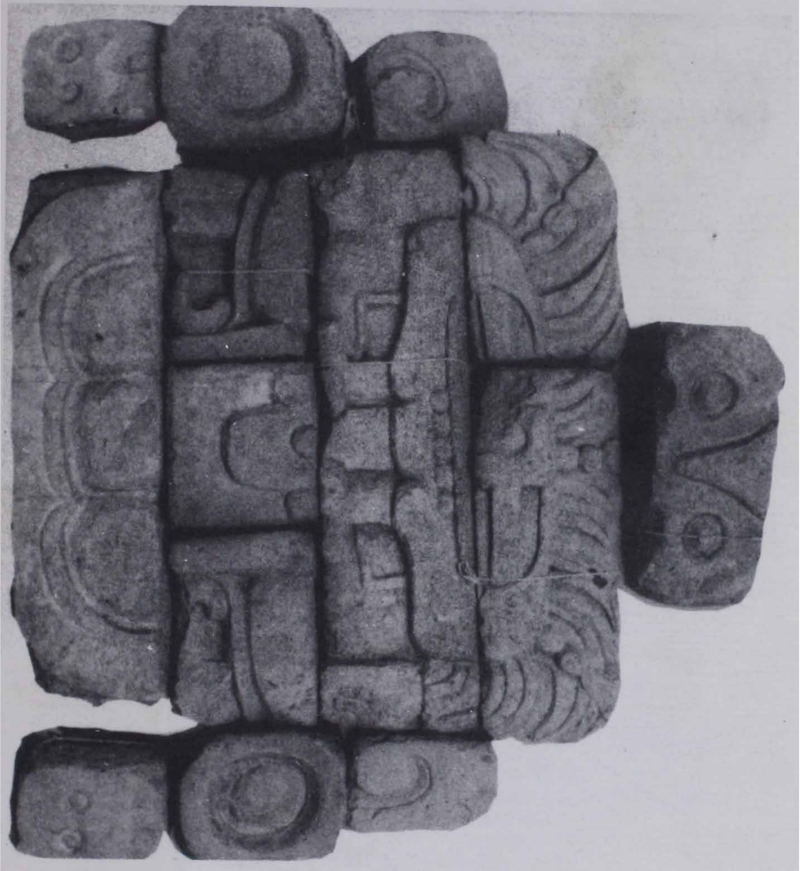
3. La Estructura 2 de El Duende.